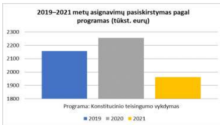
2 grafikas. 2019–2021 metų asignavimai programai

1 strateginis tikslas: Konstitucinio teisingumo vykdymas, nagrinėjant konstitucinės justicijos bylas, tinkamo konstitucinio proceso užtikrinimas